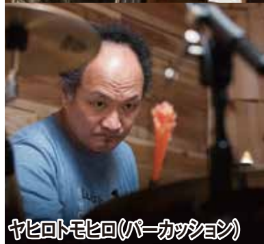
ヤビロヒトヒロ(パーカッション)